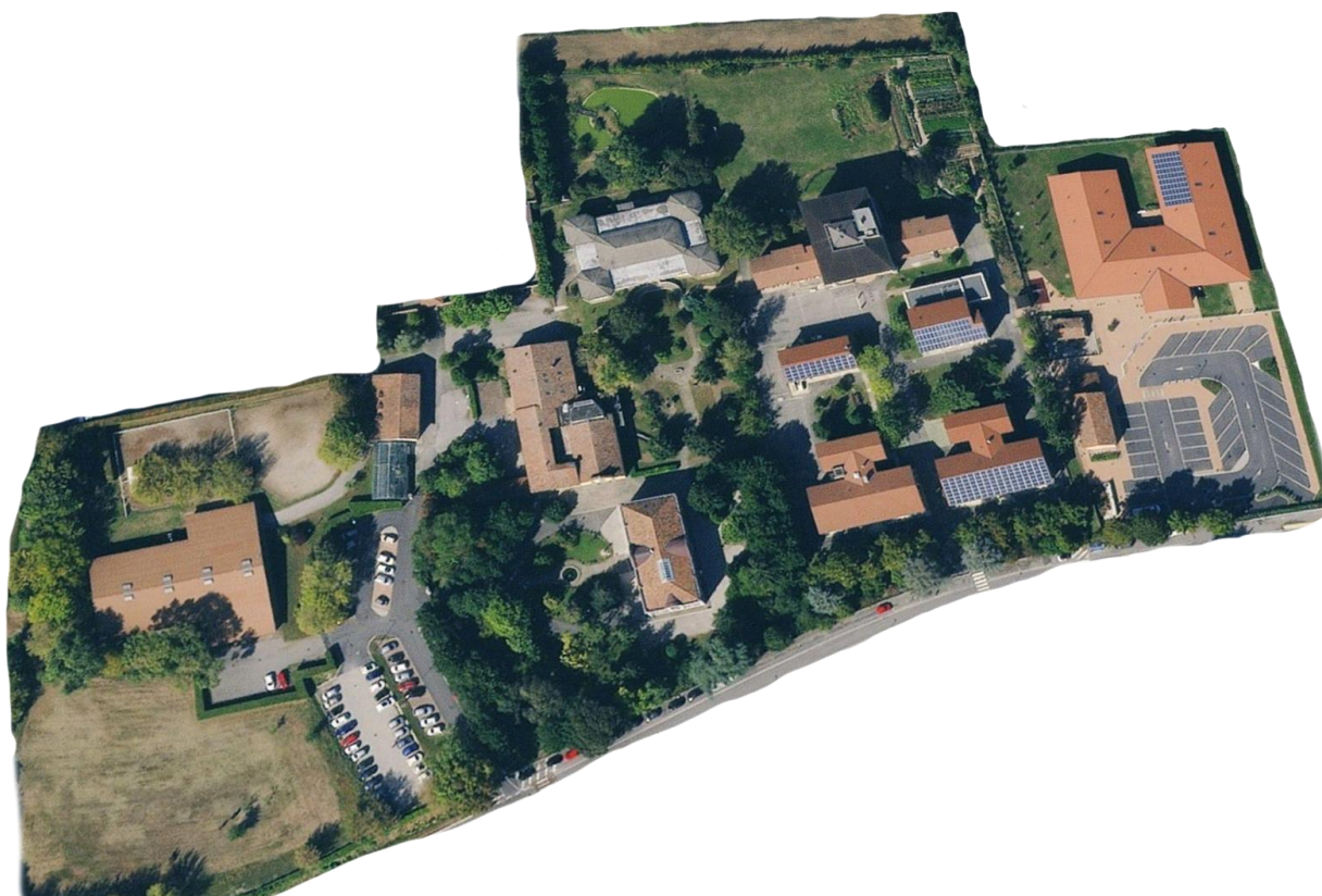
La sede dell'Associazione "Casa del Sole Onlus" – San Silvestro di Curtatone –Mn