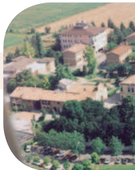
L'Associazione Casa del Sole Onlus - San Silvestro - Mn