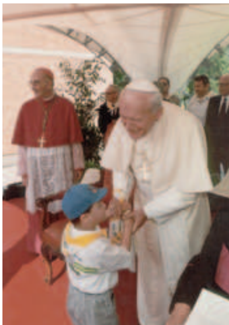
Il Papa alla Casa del Sole nel 1991

Come tale allora essa va accolta e onorata, come tale va sorretta e incoraggiata, difesa e aiutata ad esprimersi in pienezza, nella propria irripetibile pienezza”.